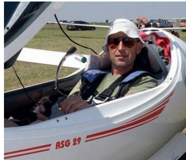
Zbigniew Nieradka Mistrz Świata w sporcie szybowcowym w klasie 18 metrowej