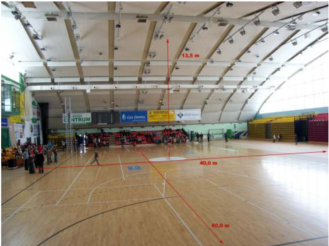
Hala II kategorii.

Tylko ok. 500 m dalej zabytkowy Rynek w Krośnie z zabudową staromiejską i licznymi atrakcjami turystycznymi.