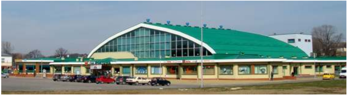
Hala Sportowo-Widowiskowa MOSiR Krosno, ul. Bursaki 29.