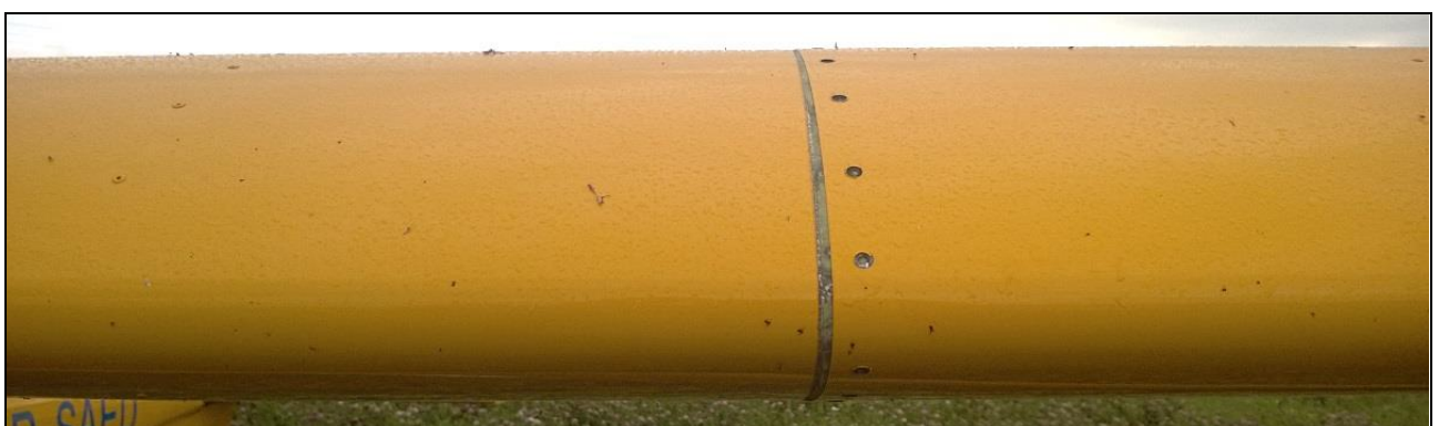
4 – Ścięty szew nitowy na połączeniu arkuszy blach pokrycia noska.