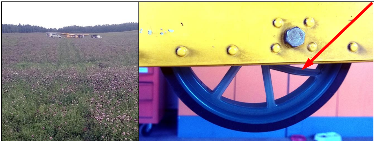
1, 2 – Miejsce lądowania z widocznym śladem i uszkodzone kółko ogonowe.

przekazywanych przez niego opisów znajdującego się pod nim terenu, nie można było ustalić jego pozycji. Po około 2 godzinach lotu i analizie ilości pozostałego na pokładzie paliwa, instruktor nadzorujący podjął decyzję i polecił uczniowi pilotowi wykonanie lądowania zapobiegawczego w terenie przygodnym. Uczeń pilot po lądowaniu ok. godz. 11:45 LMT na polu w miejscowości Wydminy k/Giżycka przez radio poinformował o miejscu lądowania, o braku obrażeń i o uszkodzeniach samolotu. W rozmowie telefonicznej uczeń pilot poinformował, że w trakcie lotu na wysokości 2000 stóp nad Bartoszczami doszło do zderzenia z nierozpoznanym obiektem, co spowodowało uszkodzenia lewego skrzydła samolotu.