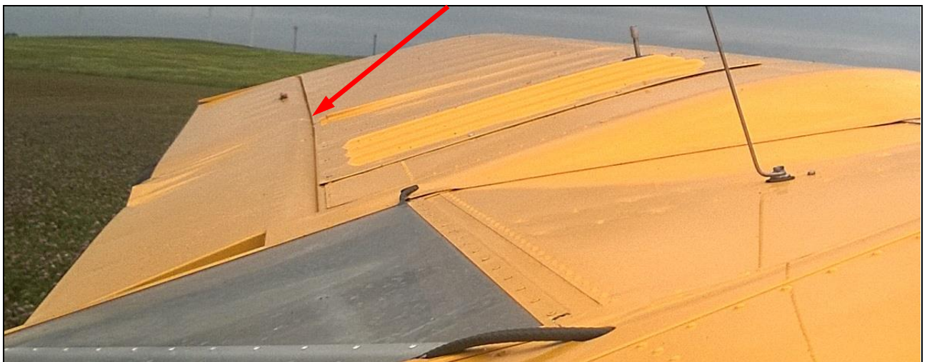
3 – Widok na górną powierzchnię lewego skrzydła. Zwraca uwagę widoczne załamanie szczeliny klapolotki.