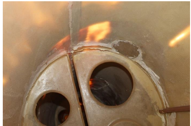
Fot. 3,4,5,8 Zdjęcia uszkodzeń kadłuba (zdjęcia nadesłane Komisji przez zgłaszającego zdarzenie)

Załoga: kobieta lat 33, nalot ogólny 131:38, nalot samodzielny 81:47, nalot w ostatnich 90 dniach 6:18 w tym samodzielnie 4:06. Nalot na szybowcu Junior 40:38 w 26 lotach. Licencja SPL wydana 19.06.2013. Srebrna Odznaka Szybowcowa. Orzeczenie lotniczo-lekarskie wydane 17.06.2015 ważne do 17.06.2020.