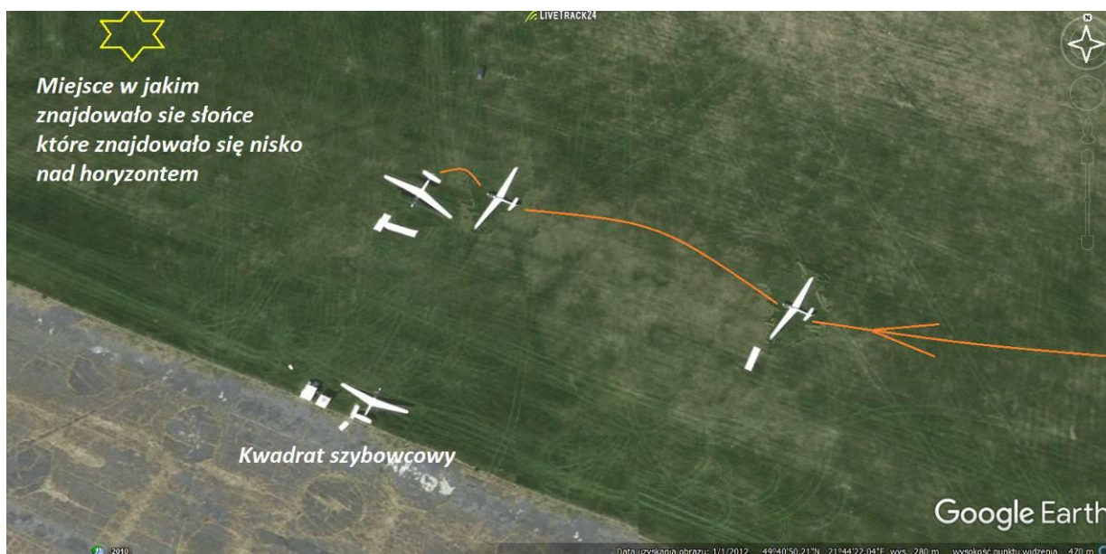
Ilustracja nr 1. Schemat lądowania.

W dniu 22 lipca 2016 r. na lotnisku w Krośnie (EPKR) odbywały się loty szkolne na szybowcu SZD -9 Bis Bocian 1E. Starty za wyciągarką odbywały się na kierunku pasa startowego 260°. Około godziny 19:43 uczeń-pilot wystartował do swojego 10 lotu tego dnia a zarazem pierwszego samodzielnego na zadanie I ćwiczenie 8. Po wykonaniu kręgu nadlotniskowego w trakcie lądowanie, uczeń pilot nie wykonał załamania lotu przed przyziemieniem i uderzył przednią płożą w nawierzchnię lotniska, odbił się i ponownie przyziemił na koło podwozia głównego wykonując cyrkiel w lewo o 90° (ilustracja nr 1). Zdaniem Komisji uczeń- pilot po odbiciu się szybowca od ziemi oddał drążek sterowy od siebie, co doprowadziło do ponownego przyziemienia szybowca z dużą siłą na płożę i koło podwozia głównego a w konsekwencji do cyrkiela i uszkodzenia szybowca.