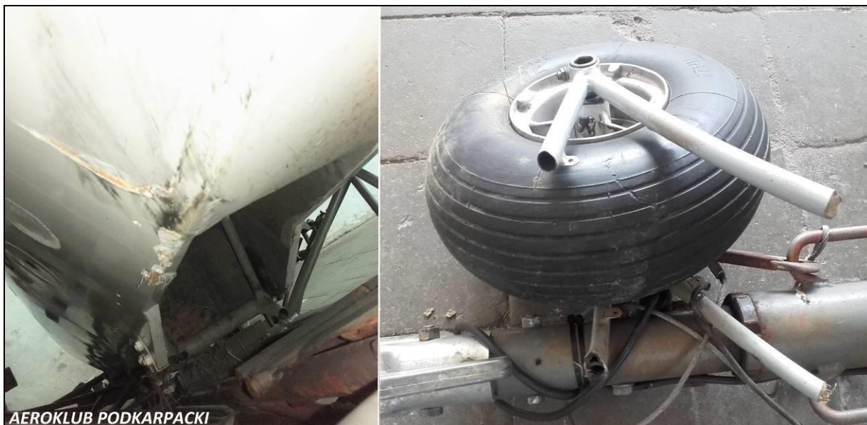
Ilustracja nr 3. Uszkodzenia podwozia głównego.