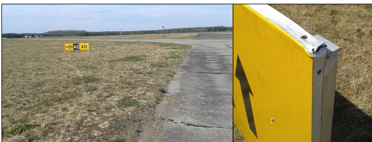
5, 6 – Skrzyżowanie dróg kołowania A i D z widoczną tablicą informacyjną oraz zbliżenie tablicy z widocznym drobnym uszkodzeniem po zaczepieniu skrzydłem przez samolot.