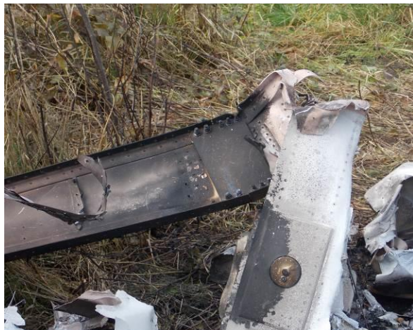
Rys. 10 Zbliżenie na złamany dźwigar lewego skrzydła.