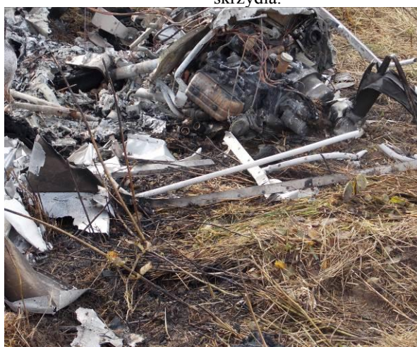
Rys. 12 Zbliżenie na przednią część kadłuba w widoku z przodu.