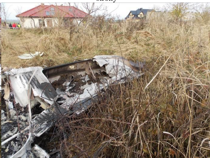
Rys. 9 Widok na prawe skrzydło