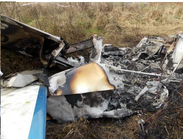
Rys. 11 Zbliżenie na tylną część kadłuba.