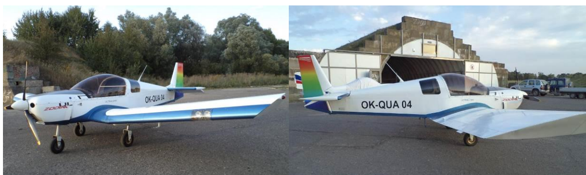
Rys. 3 Samolot ultralekki Zenair CH 601 UL Zodiak; OK-QUA 04 przed wypadkiem