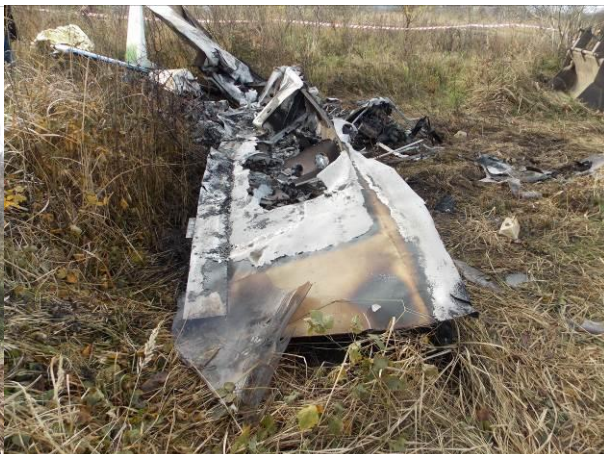
Rys. 5 Widok na wrak samolotu z prawej strony.