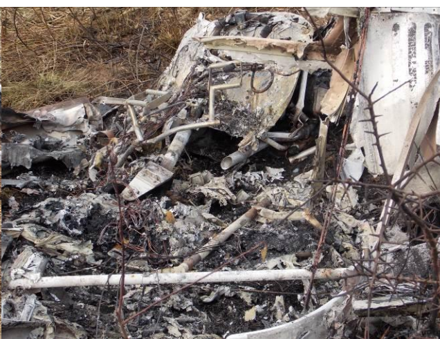
Rys.13 Zbliżenie na przednią część kadłuba w widoku od tyłu.