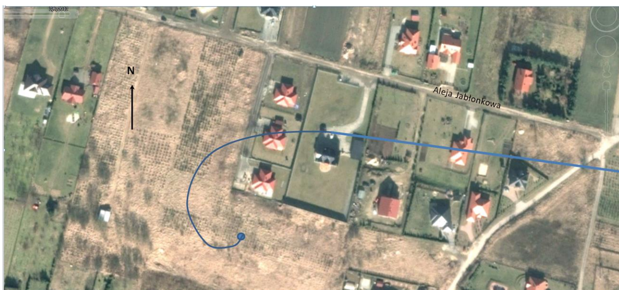
Rys. 2 Końcowa część trasy lotu samolotu OK-QUA 04.