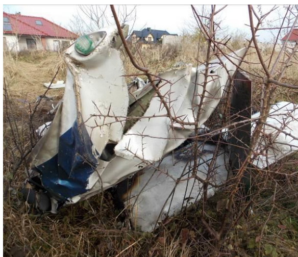
Rys.8 Zbliżenie na wrak samolotu z tyłu.