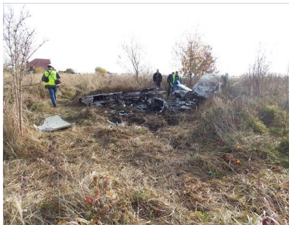
Rys.4 Widok na wrak samolotu z przodu.